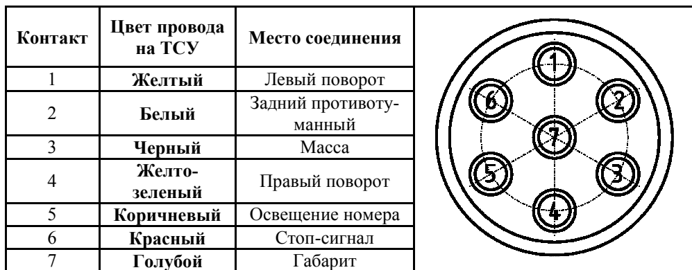
СХЕМА МОНТАЖА ТСУ