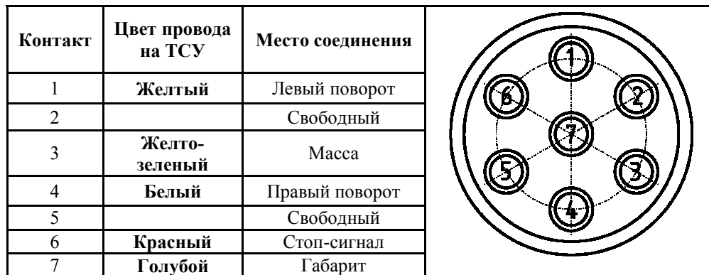
СХЕМА МОНТАЖА ТСУ