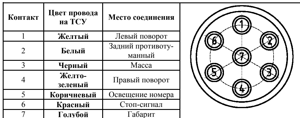
СХЕМА МОНТАЖА ТСУ